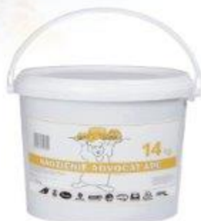
NADZIENIE APC ADVOCAT