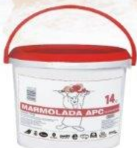
MARMOLADA APC WIELOOWOCOWA