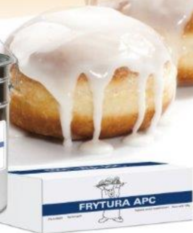
FRYTURA APC - STAŁA