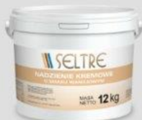
SELTRE NADZIENIE KREMOWE O SMAKU WANILIOWYM