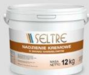
SELTRE NADZIENIE KREMOWE O SMAKU KARMELOWYM