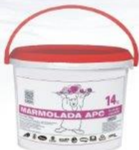
MARMOLADA APC O SMAKU RÓŻANYM