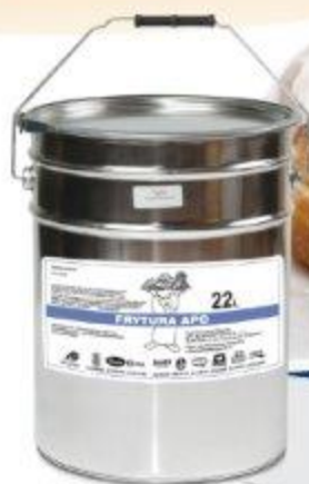
FRYTURA APC - PLYNNA