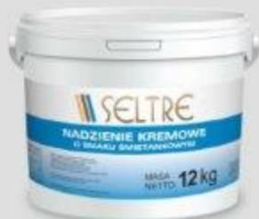
SELTRE NADZIENIE KREMOWE O SMAKU ŚMIETANKOWYM