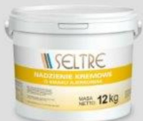
SELTRE NADZIENIE KREMOWE O SMAKU AJERKONIAK