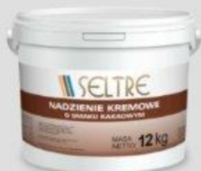
SELTRE NADZIENIE KREMOWE O SMAKU KAKAOWYM